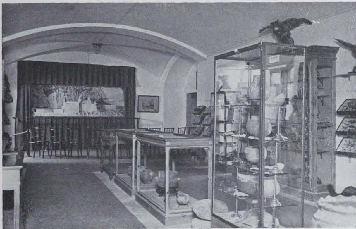
Fig. 358. — Montserrat : Una de les instal·lacions del Museu prehistòric

CULTURA HALLSTÄTTICA. — D'aquesta cultura tenim ben poca cosa, la suficient, però, per ésser-hi representada. Ultra bastants fragments de les típiques tapadores amb zones concèntriques, posseïm 2 vasos, l'un d'uns 30 cm. ornat a la vora amb un cordó d'impressions digitals molt