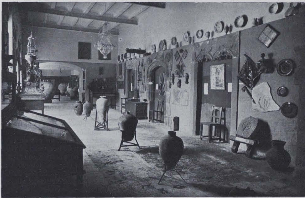
Fig. 360. — Museu de Sabadell : Sala d'objectes medievals i moderns fins el segle XIX